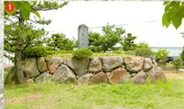
1 福島城址 高城の平野の形跡に空の堀溝を築き、石を積み上げて築かれた石垣が残り、