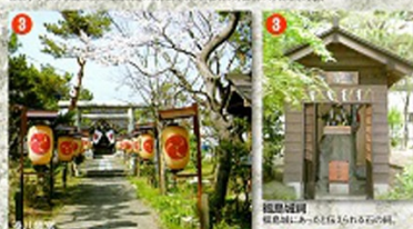
2 福島城門 福島城にあったとされる石垣の跡、