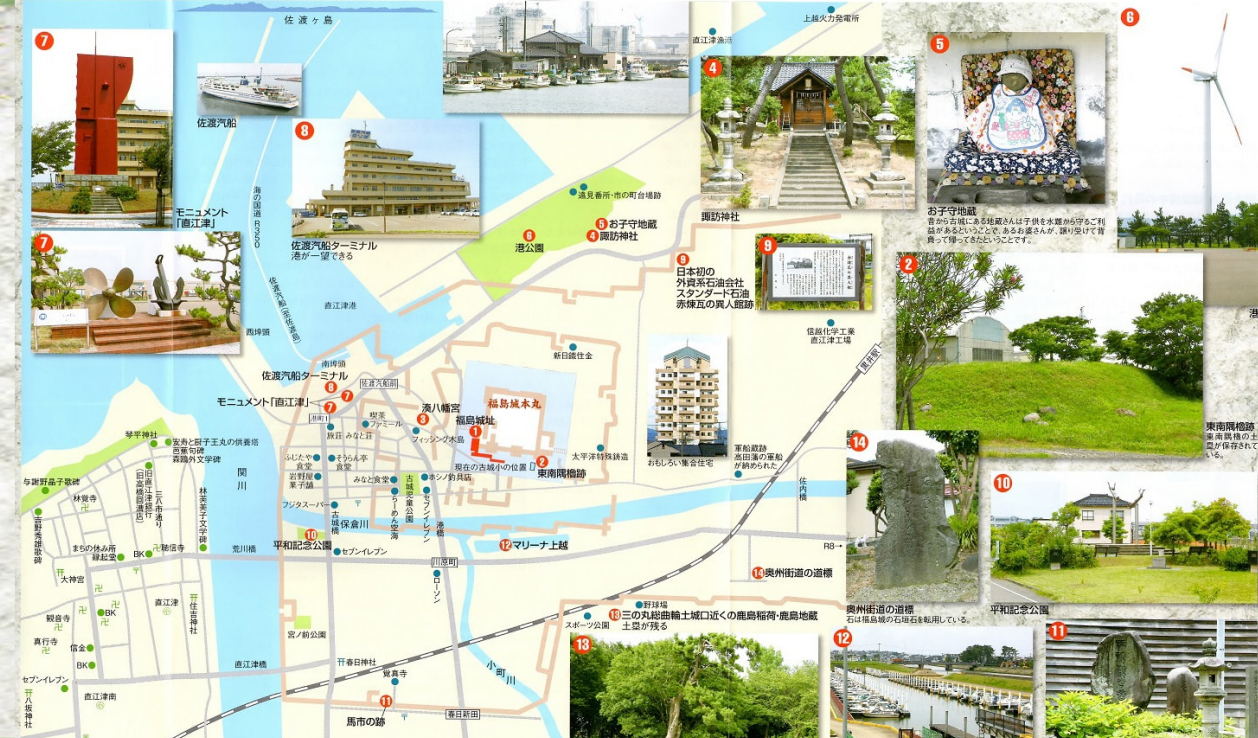
福島城の丸一、二、三の丸の大きさを理解するために、現在の地図の上に城郭のイメージを乗せてみました。福島城址を研究している渡邊昭二氏の研究をもとに作成しました。