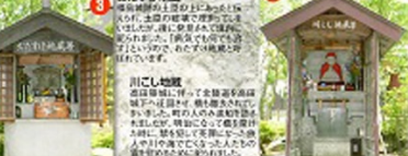
3 川こし地蔵 福島城址に伝わる金輪寺の高層城下へは、川を渡り、橋を架かす必要がなかった。町の人々の生活に支えられた。町の人々の生活に支えられた。町の人々の生活に支えられた。